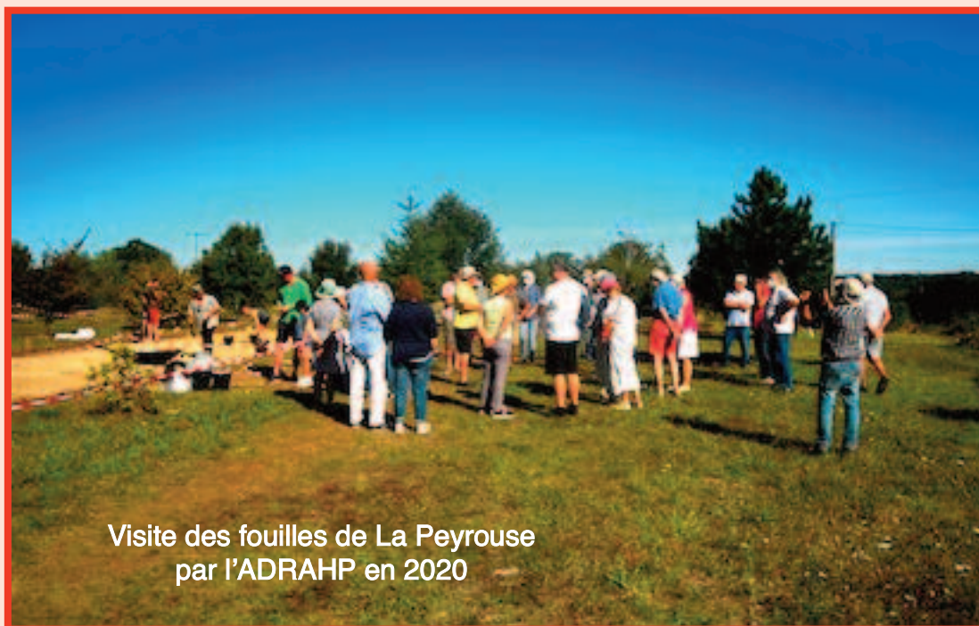
Visite des fouilles de La Peyrouse par l'ADRAHP en 2020

Si le temps le permet découverte de la voie gauloise de long parcours qui passe sur le site, voie gauloise qui liait Bourges/Argentonmagus/Limoges/Ouesona-Périgueux à Agen en passant par La Peyrouse et Villeneuve-sur-Lot (Excisum).