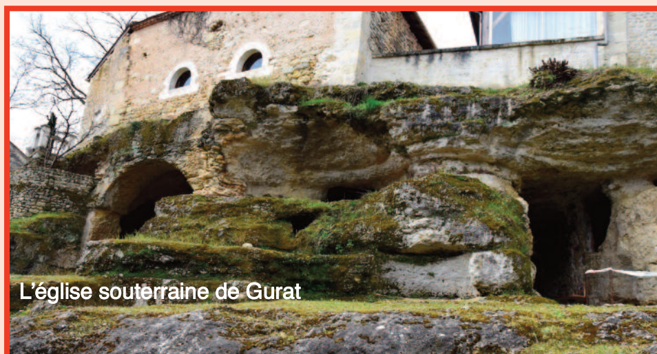
L'église souterraine de Gurat

A 12 h 30/13 h pique-nique convivial tiré du sac.