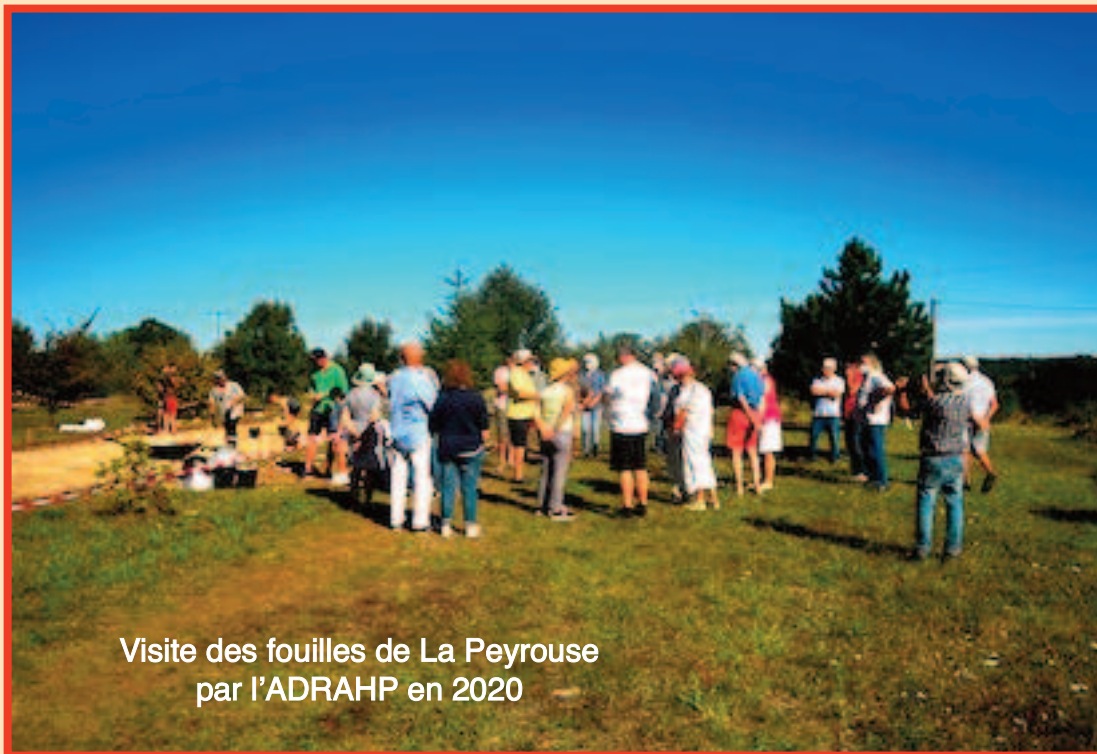
Visite des fouilles de La Peyrouse par l'ADRAHP en 2020

Nous comptons sur votre présence et votre bonne humeur pour faire de ces journées une réussite.