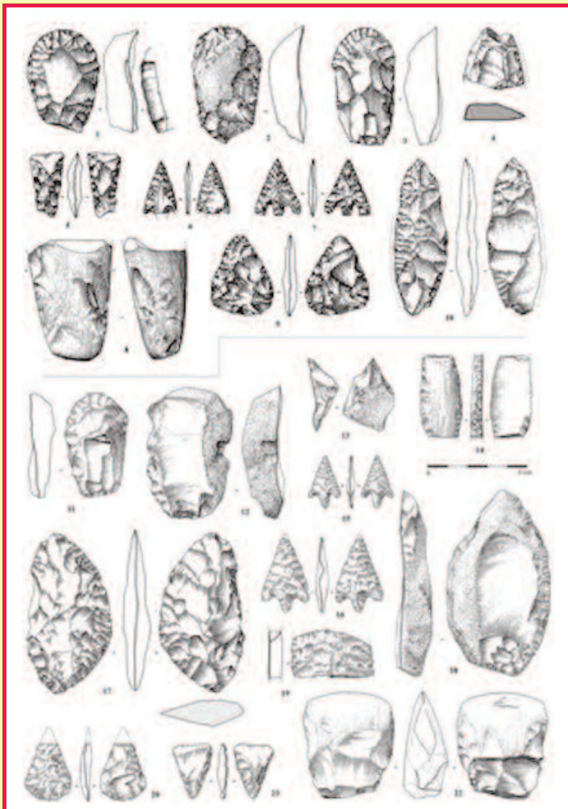
Exemples de mobilier lithique artenacien de Beauclair à Douchapt, et du Gros Bost à Saint-Méard-de-Dronne.