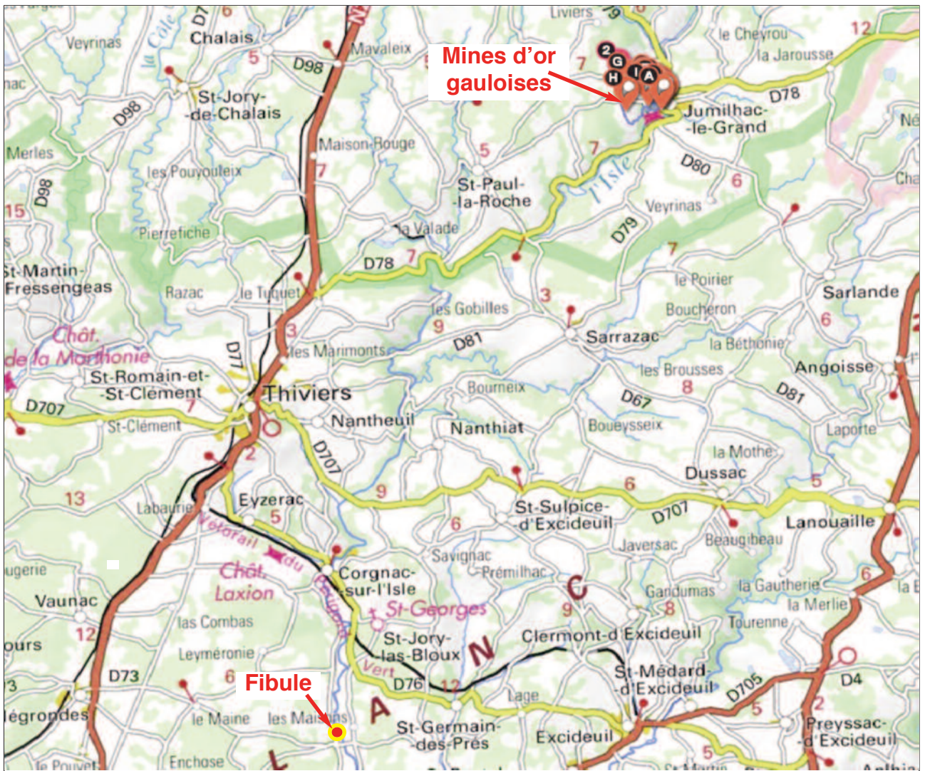
Figure 3 - Lieu de la découverte sur l'Isle en aval des mines d'or de Jumilhac-le-Grand. (D'ap. carte IGN).

2 e et du 3 e quarts du I er siècle av. J.-C. On le trouve sur les oppida , les habitats d'autres types et plus rarement dans les sépultures et les sanctuaires (Feugère, 1985, p. 189).